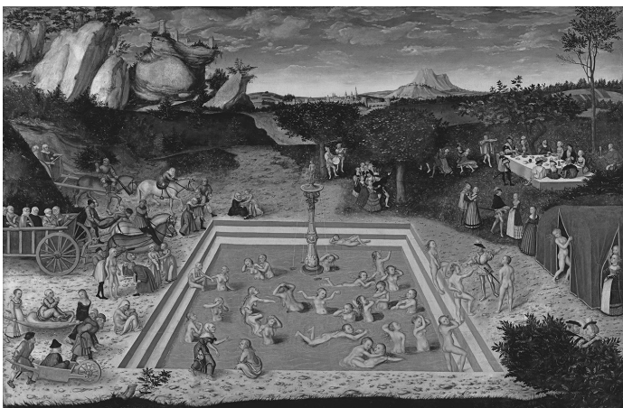
Der Jungbrunnen, Lucas Cranach der Ältere, 1546 2

Lüge 1: Jugend ist schön, Alter bloß eine schwer zu tragende Last. Kennen Sie das Bild mit dem Titel »Der Jungbrunnen« von Lucas Cranach dem Älteren aus dem Jahre 1546? Es befindet sich in der Gemäldegalerie in Berlin.