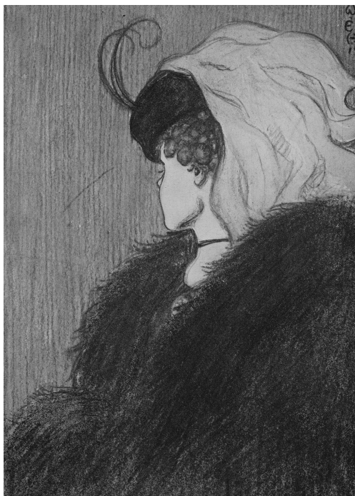
Meine Frau und meine Schwiegermutter 1

Falls Sie wünschen, hier noch etwas mehr Denk-Nachschub: Bestimmt kennen Sie das folgende Bild: